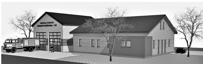
Mit dieser Visualisierung wurden die Fördermittel beantragt

Am 29. April 2022 übergab Minister Stübgen Bürgermeister Thomas Zenker und der Ortswehr Großräschen-Ost einen Fördermittelscheck in der Höhe von 450.000 €. Die Stadt Großräschen hatte im letzten Jahr einen Antrag auf Gewährung einer Zuwendung gemäß Feuerwehrinfrastruktur-Richtlinie gestellt. Das neue Förderprogramm unterstützt den Neubau von Feuerwehrgaragen und die Anschaffung von Feuerwehrtechnik.